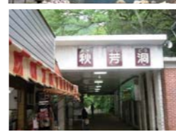
▲夏でも長袖が必要ほどヒンヤリ感がある洞内は、気温は常時17度あたり。暑くなるこれからの季節にはピッタリかも?

今回は紹介できませんでしたが、ベタ過ぎるほど有名な観光地を忘れちゃいけない。圧倒的な存在感と、大自然の鼓動を感じるのことができる場所、秋芳洞です。