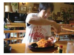
▲もうここまで書いてしまうと、お前ゆう坊でもくめっちでもなかやろ? と疑われてしまうそうですが、ほらあゆう坊が食べてるでしょ...!!