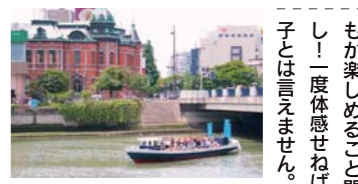
▲そしてもう一つオススメなのが、その屋台街近くを流れる那珂川を走る「那珂川水上バス」。夜とは一味違った福岡の街並みを楽しめますよ。

ひとたび暖簾をくぐれば、誰もが十年來の友人のように和気あいあいとした雰囲気を楽しめる、通な大人の大家酒場——屋台。ここ「中洲屋台街」は、異外から多数の観光客が集まる博多の夜の名所。中洲の夜を彩る数多くの屋台は、こも安くて旨いものばかり。活気と人情味に溢れる歓楽街とあって、老若男女誰もが楽しめること間違いなし! 一度体感せねば、博多っ子とは言えません。